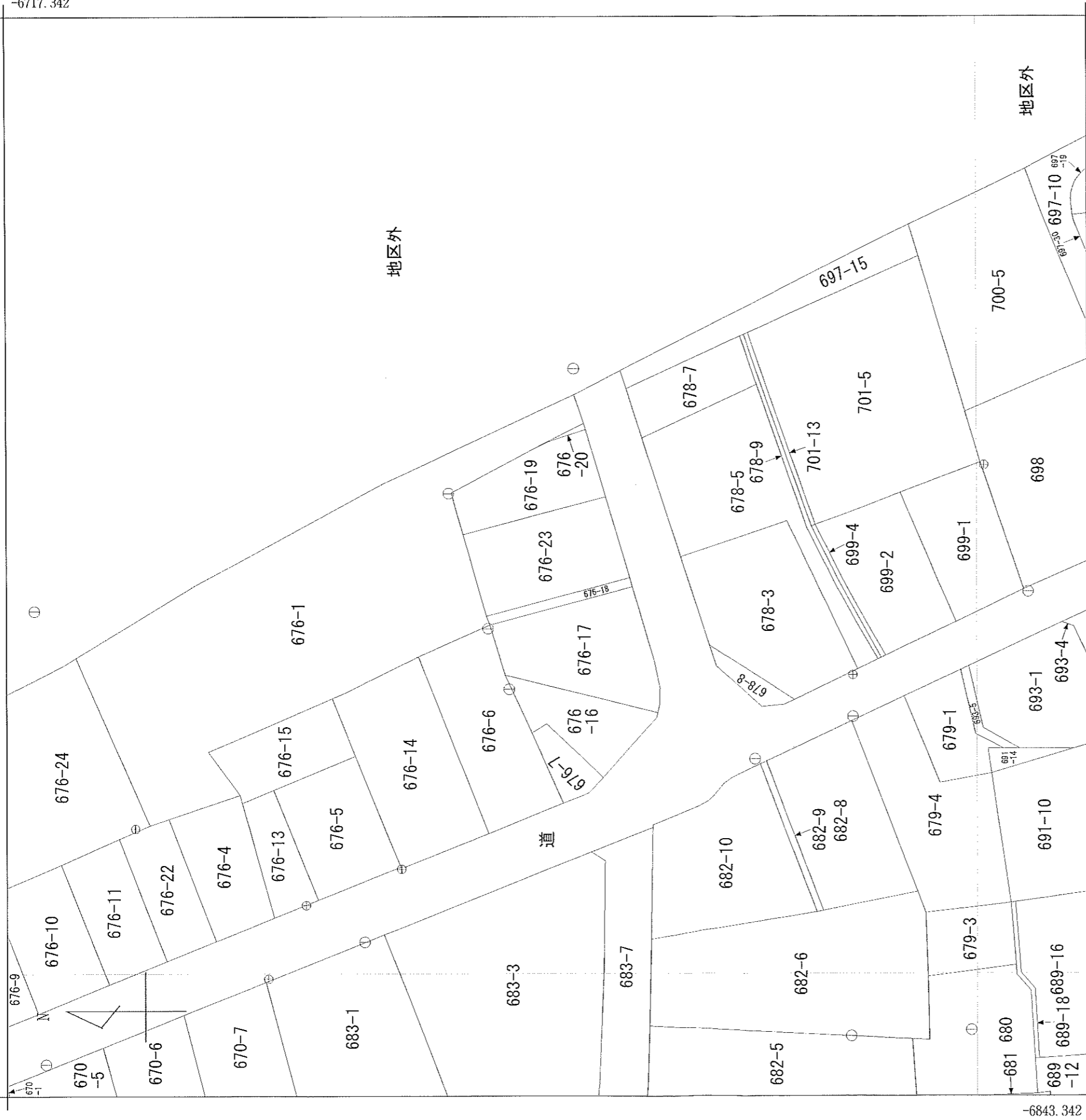
(座標値種別：図上測定)